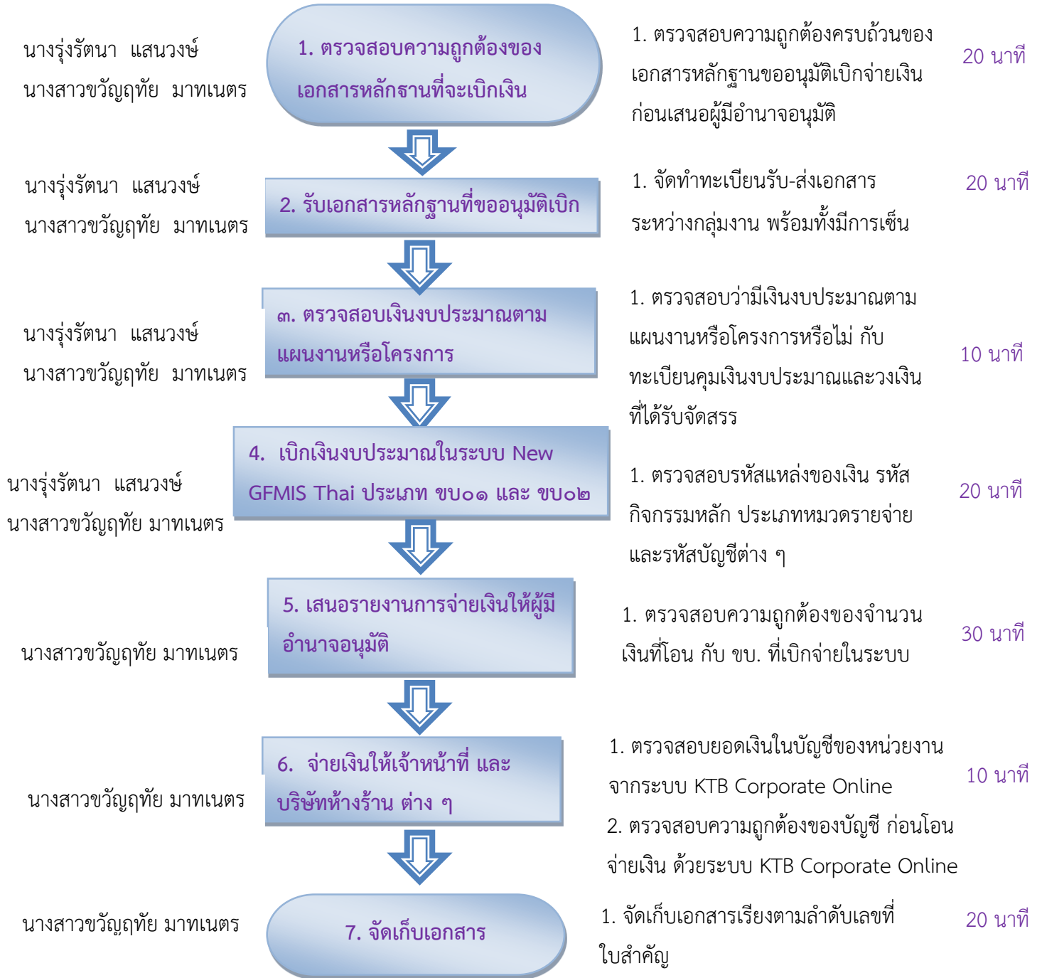
แผนภาพที่ 3 ผังกระบวนการดำเนินงานเบิกจ่ายงบประมาณสำนักงานสาธารณสุขจังหวัดยโสธร